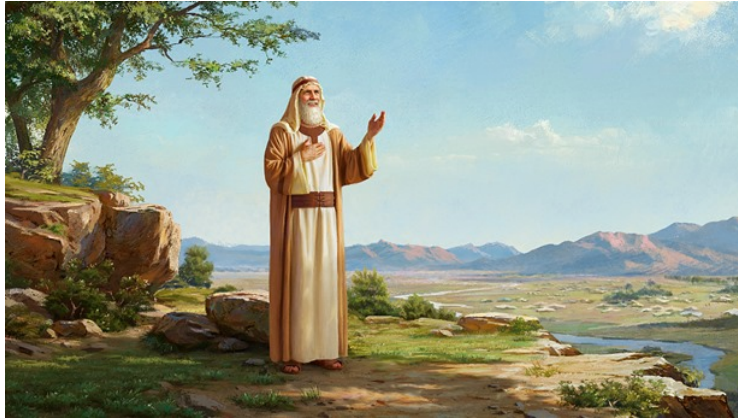
Gambar: 3. Abraham yang rendah hati

Di antara berbagai pilihan hidup, orang-orang selibater, khususnya calon imam, merupakan bagian dari kelompok minoritas yang turut berpartisipasi dalam solidaritas bagi mereka yang terpinggirkan. Riyanto menyebut kelompok-kelompok minoritas ini sebagai "Liyani", yang tidak menyusun mayoritas dari total populasi dan sering kali tidak diperhitungkan secara politis dalam kelompok masyarakat tertentu (Riyanto et al., 2011). Janganlah menganggap bahwa jumlah merupakan ukuran keberhasilan eksistensi kaum selibater, justru karena jumlahnya yang tidak banyak, mereka justru memberikan kontribusi kualitas iman dan spiritual yang membuat Gereja, sejak zaman dahulu hingga kini, tetap bertahan. Para selibater bagaikan daun-daun kering yang jatuh di antara rimbunnya daun-daun hijau yang masih menempel pada cabang-cabang dan ranting. Meskipun jumlahnya sedikit, daun-daun kering tersebut tetap menyuburkan berbagai tanaman yang ada di atasnya. Begitu pula dengan peran para selibater yang membawa rahmat Tuhan, yang memberi kekuatan bagi pertumbuhan Gereja. Oleh karena itu, sebagai seorang selibater, saya harus selalu bersyukur atas panggilan ini di setiap waktu, karena anugerah yang diberikan oleh Kristus Sang Guru yang kita imani.