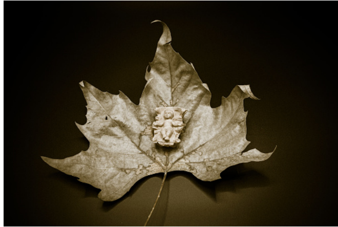
Gambar: 2. Ilustrasi Spiritual Daun Kering